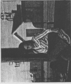
SOLA NO, CON AMIGOS, SI. ABAJO, UNA RECREACIÓN DE LO QUE SERÁ LA CONCURRIDA ACCIÓN QUE LÓPEZ (SOBRE ESTAS LINEAS) LLEVARÁ A CABO EN EL EDIFICIO DE GEHRY.