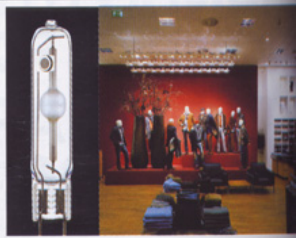
(9-2) Lámpara de halogenuros metálicos de Osram para iluminación de tiendas