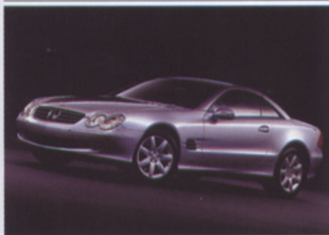
(8-2) Premio para Mercedes en Alemania

Esta nueva lámpara está disponible en el tono Blanco Cálido De Luxe (90 WDL), y ofrece una temperatura de color de 3000 K. Su reproducción cromática de Ra>90, la sitúa en el grupo 1A. Destaca como nota característica en esta lámpara, su elevada reproducción de rojo, de Ra>60, lo que la convierte en la primera lámpara de halogenuros metálicos en alcanzar dicha característica. La lámpara Powerball Shoplight de 70W tiene un flujo luminoso de 5700 lúmenes y por tanto una eficacia luminosa de más de 80 lúmenes por vatio. Su intensidad luminosa y estabilidad del color permanecen constantes a lo largo de